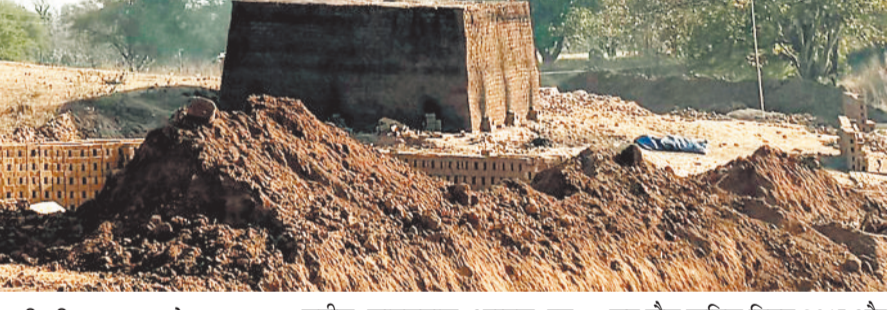
हरिभूमि न्यूज ॥ बैकुण्ठपुर