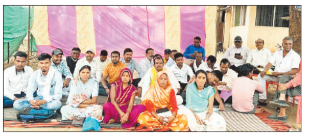
धरना को समर्थन देने पहुंचे सरपंच।

मिली जानकारी के अनुसार जमगहना में सिग्नल ढक कर कोयले से भरी रेल मालगाड़ी के धीमा होने के साथ ही करीब 20 की संख्या में लोग मालगाड़ी के डिब्बे में चढ़ना शुरू कर दिए और कुछ ही देर में बड़ी मात्रा में अज्ञात कोयला चोरों के झर्रा कोयले की बोरियों में भरकर चोरी कर ले जाने में सफल रहे। घटना की सूचना मिलते ही रेलवे अधिकारी और पुलिस टीम मौके पर पहुंचे और जांच शुरू कर दी गई। कुल मिलाकर फल्की स्टाइल में अंजाम दी गई इस चोरी में रेलवे की सुरक्षा व्यवस्था पर सवाल खड़े कर दिए हैं। अब देखना यह होगा कि इस विरोध का पड़ाव कब तक होता है।